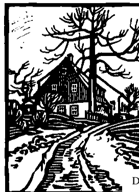
Dorfstraße im Erzgebirge von R. Manuwald

Treff der QUER-BEET-Wandergruppe zur Planung 2014. Vorschläge werden gern entgegengenommen. Alle Interessierten sind herzlich eingeladen.